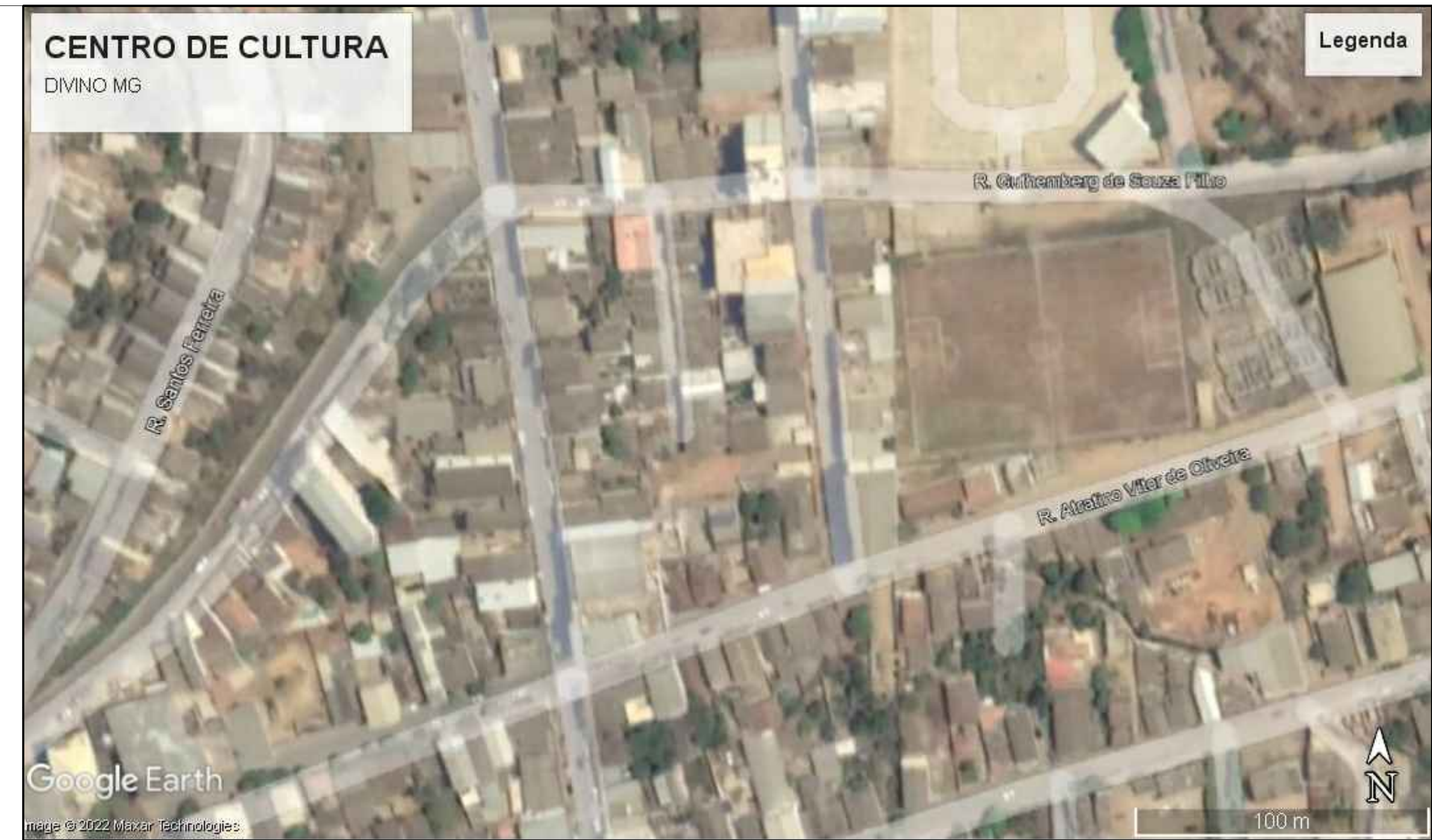
LOCALIZAÇÃO E COBERTURA